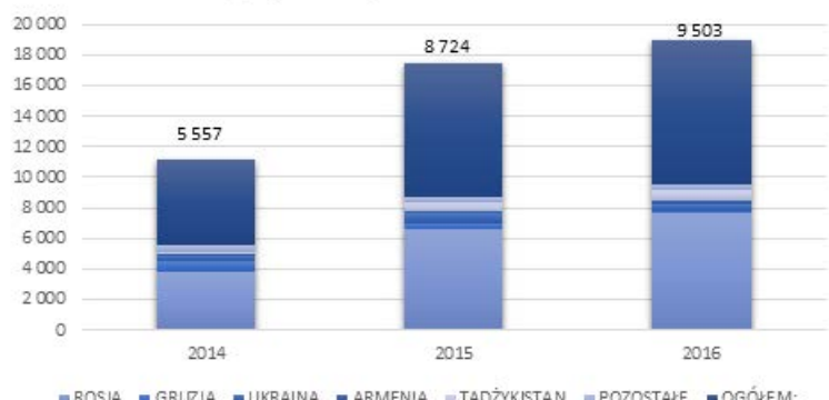
Liczba osób ubiegających się o udzielenie ochrony międzynarodowej w RP w latach 2014-2016